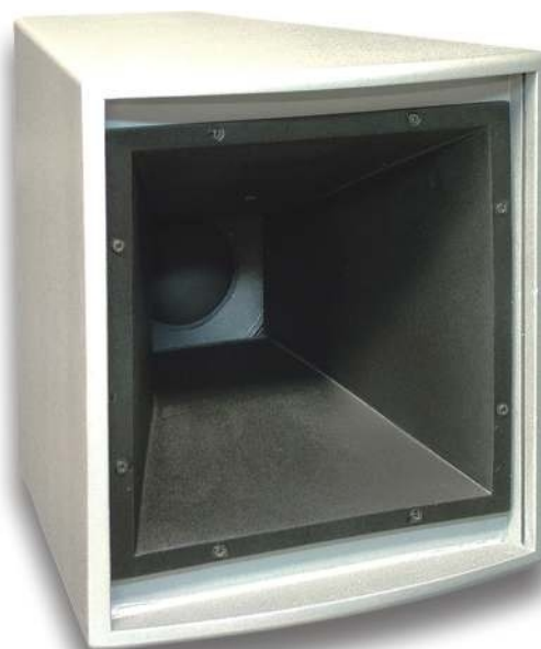
Foto senza griglia